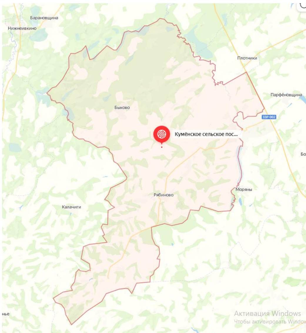
Рисунок 1 - Состав Куменского сельского поселения

Численность населения на 01.01.2022 года составила 958 человек.